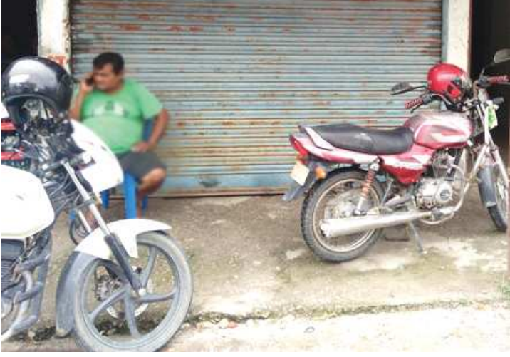
‘भारतका केही ग्यारेजले नेपालका भित्री बजारका ग्यारेजमा भारतीय मेकानिक्स राखेर सम्पर्क विस्तार गर्ने गरेका छन् ।’

खुला सीमाका कारण असुरक्षा मात्र बढेको छैन नेपाली बजार नराम्रोसँग प्रभावित समेत बनेको छ । भारतीय व्यापारीका कारण खासगरी सीमावर्ती बजारमा सञ्चालित मोटरसाइकल ग्यारेज र पादर्स व्यवसायीहरू घाटामा छन् । भूपाका काँकरभिट्टा, धुलाबारी, चारआली, बिर्तामोड, भद्रपुर, सुरुङ्गा क्षेत्रका ग्यारेजहरू पानीट्याङ्कीमा रहेका ग्यारेजका कारण बढी मारमा परेका छन् ।